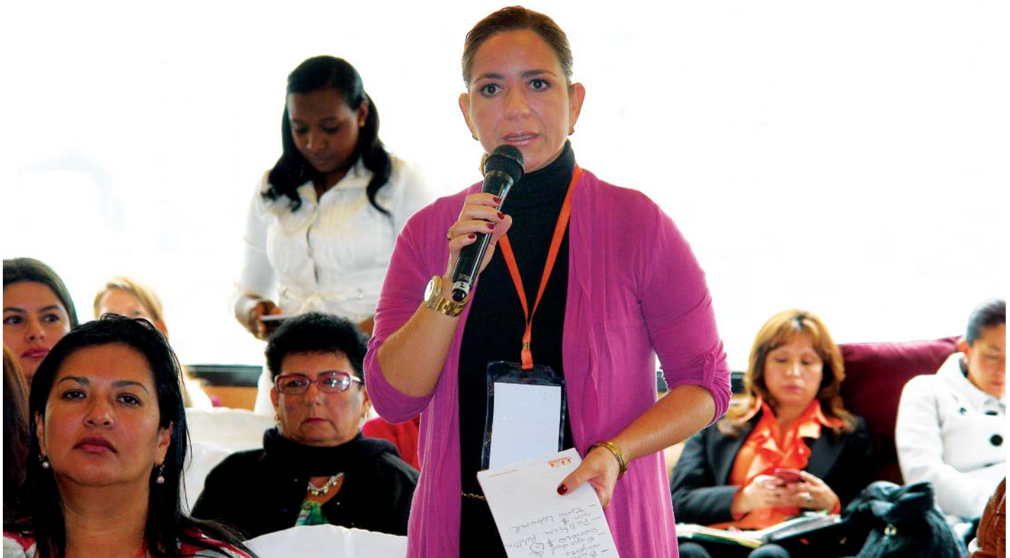
Desde arriba: Encuentro de mujeres por la paridad en Uruguay. Cumbre Nacional de Mujeres Electas en Colombia organizado por el Ministerio del Interior, PNUD, ONU Mujeres, la Mesa de Género de la Cooperación Internacional, NDI e Idea Internacional.