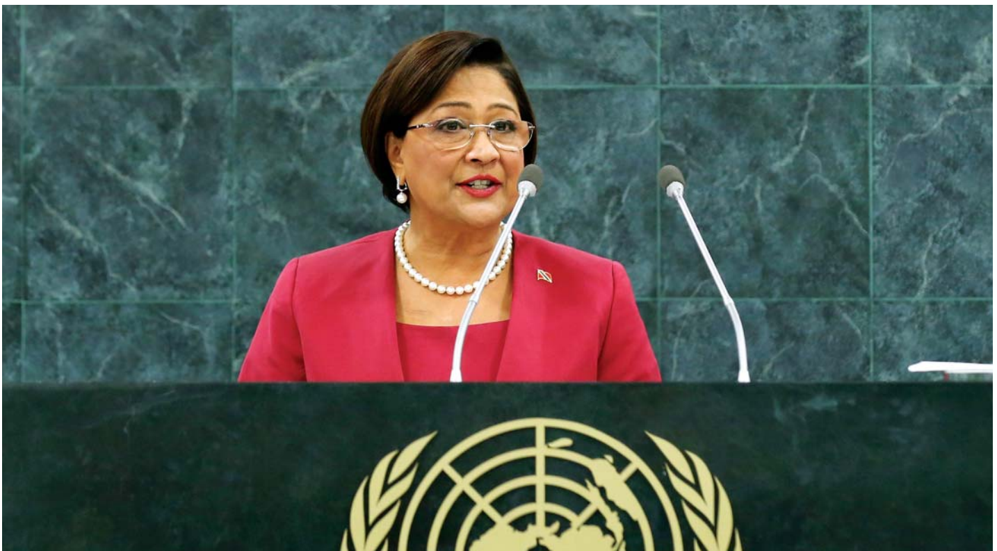
Desde arriba: Portia Simpson Miller, Primera Ministra de Jamaica, a su llegada en Ginebra para el 50 Aniversario de UNITAR. Foto: Naciones Unidas. Kamlia Persad-Bissessar, Primera Ministra de Trinidad y Tobago, se dirige el debate general de la sesión 68 de la Asamblea General de las Naciones Unidas. Foto: Naciones Unidas.