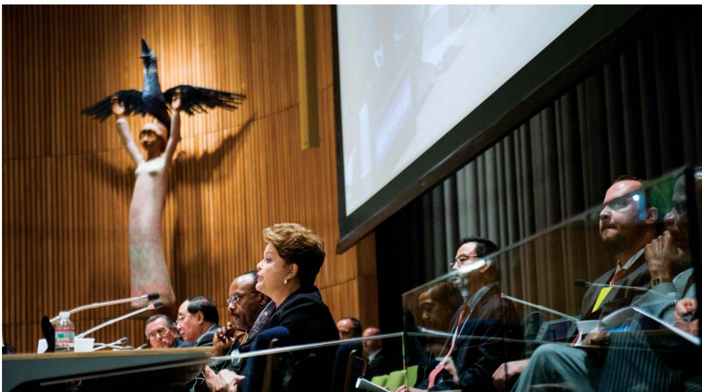
Desde arriba: Las presidentas de Chile, Michelle Bachelet, y de Argentina, Cristina Fernández, participan de la Cumbre BRICS UNASUR en Brasilia. Dilma Rousseff, Presidenta de Brasil, interviene durante la reunión inaugural del Foro de Política de Alto Nivel sobre Desarrollo Sostenible.