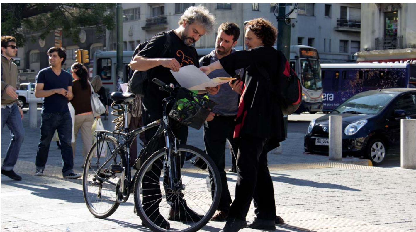
Desde arriba: La Presidenta de Chile, Michelle Bachelet, llega al Palacio de la Moneda. Recolección de firmas “por la paridad” en Uruguay, impulsado Cotidiano Mujer, CIRE y CNS Mujeres, con el apoyo de ONU Mujeres.